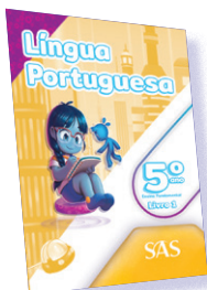
LÍNGUA PORTUGUESA 3 LIVROS PRINCIPAIS