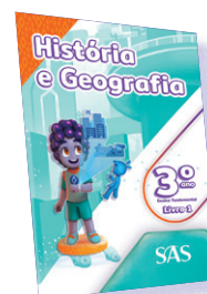
HISTÓRIA E GEOGRAFIA 3 LIVROS PRINCIPAIS