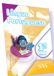
LÍNGUA PORTUGUESA 3 LIVROS PRINCIPAIS