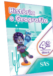
HISTÓRIA E GEOGRAFIA 3 LIVROS PRINCIPAIS