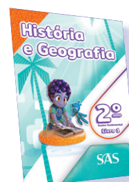
HISTÓRIA E GEOGRAFIA 3 LIVROS PRINCIPAIS