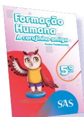
FORMAÇÃO HUMANA 4º E 5º ANOS