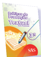
PRÁTICAS DE PRODUÇÃO TEXTUAL 3º, 4º E 5º ANOS