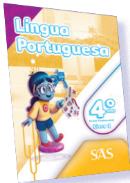
LÍNGUA PORTUGUESA 3 LIVROS PRINCIPAIS