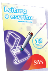
LEITURA E ESCRITA ATIVIDADES SUPLEMENTARES 1º ANO