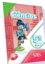
CIÊNCIAS 3 LIVROS PRINCIPAIS