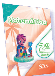
MATEMÁTICA 3 LIVROS PRINCIPAIS