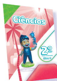
CIÊNCIAS 3 LIVROS PRINCIPAIS