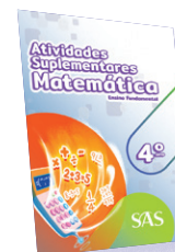
MATEMÁTICA ATIVIDADES SUPLEMENTARES 4º E 5º ANOS