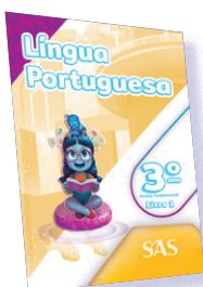
LÍNGUA PORTUGUESA 3 LIVROS PRINCIPAIS