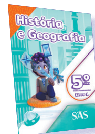
HISTÓRIA E GEOGRAFIA 3 LIVROS PRINCIPAIS