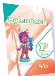
MATEMÁTICA 3 LIVROS PRINCIPAIS