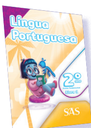
LÍNGUA PORTUGUESA 3 LIVROS PRINCIPAIS