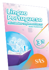
LÍNGUA PORTUGUESA ATIVIDADES SUPLEMENTARES 2º E 3º ANOS