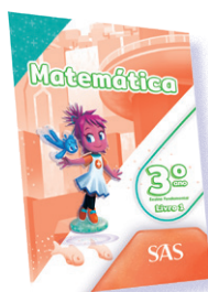
MATEMÁTICA 3 LIVROS PRINCIPAIS