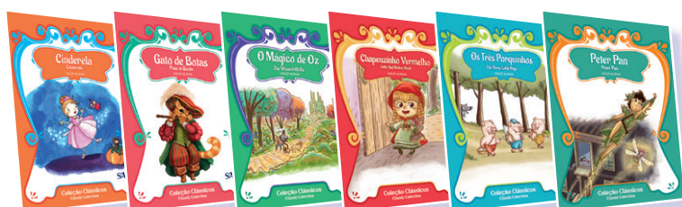
COLEÇÃO CLÁSSICOS DA LITERATURA 1º ANO