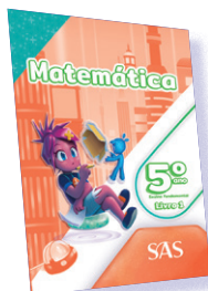
MATEMÁTICA 3 LIVROS PRINCIPAIS