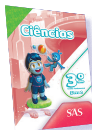
CIÊNCIAS 3 LIVROS PRINCIPAIS