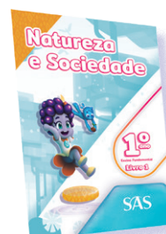
NATUREZA E SOCIEDADE 3 LIVROS PRINCIPAIS