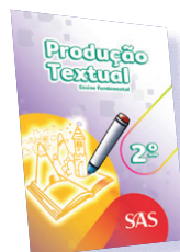
PRODUÇÃO TEXTUAL 1º E 2º ANOS