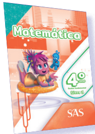
MATEMÁTICA 3 LIVROS PRINCIPAIS