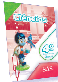
CIÊNCIAS 3 LIVROS PRINCIPAIS